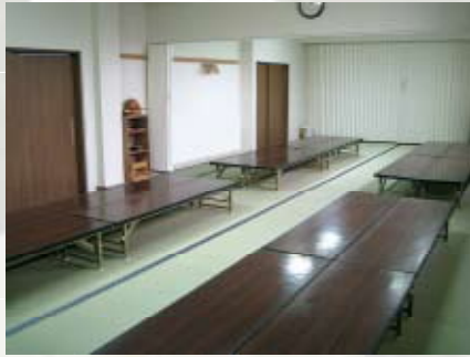
大和室 ご家族葬、ご会食にご利用いただけます。