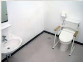
車椅子用トイレ (バリアフリー)